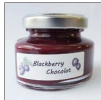
ブラックベリーショコラ 45g