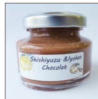
獅子柚子&伊予柑ショコラ 45g

無農薬栽培の国産レモンのマーマレード。風味豊かでマイルドな酸味で、何ともさわやかなマーマレード。