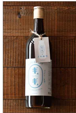
ギューギュー コーヒー牛乳の素 4 562464 170164

ギューギューは珈琲専門店アロバーがこだわりを詰め込んだ、珈琲牛乳を飲むために最適な珈琲牛乳の素です。 牛乳を混ぜるだけで簡単に美味しい珈琲牛乳ができますので、ギューギューと飲み干してください。