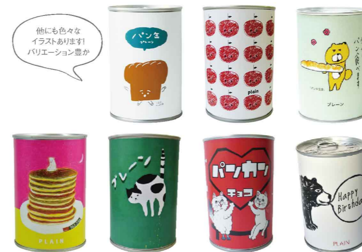
okcoffee メープル 4 560311 732183