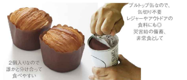
2個入りなので 誰かと分け合っ て食べやすい

災害時用の備蓄、非常食として (プルトップ缶なので、缶切り不要) レジャーやアウトドアの食料にも◎