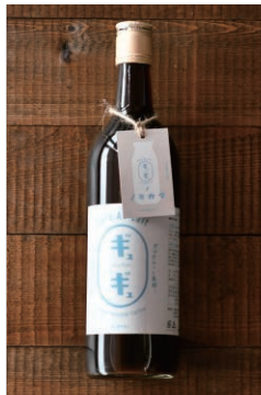
ギュギュ コーヒー牛乳の素

牛乳を混ぜるだけで簡単に美味しい珈琲牛乳ができますので、ギュギュっと飲み干してください。